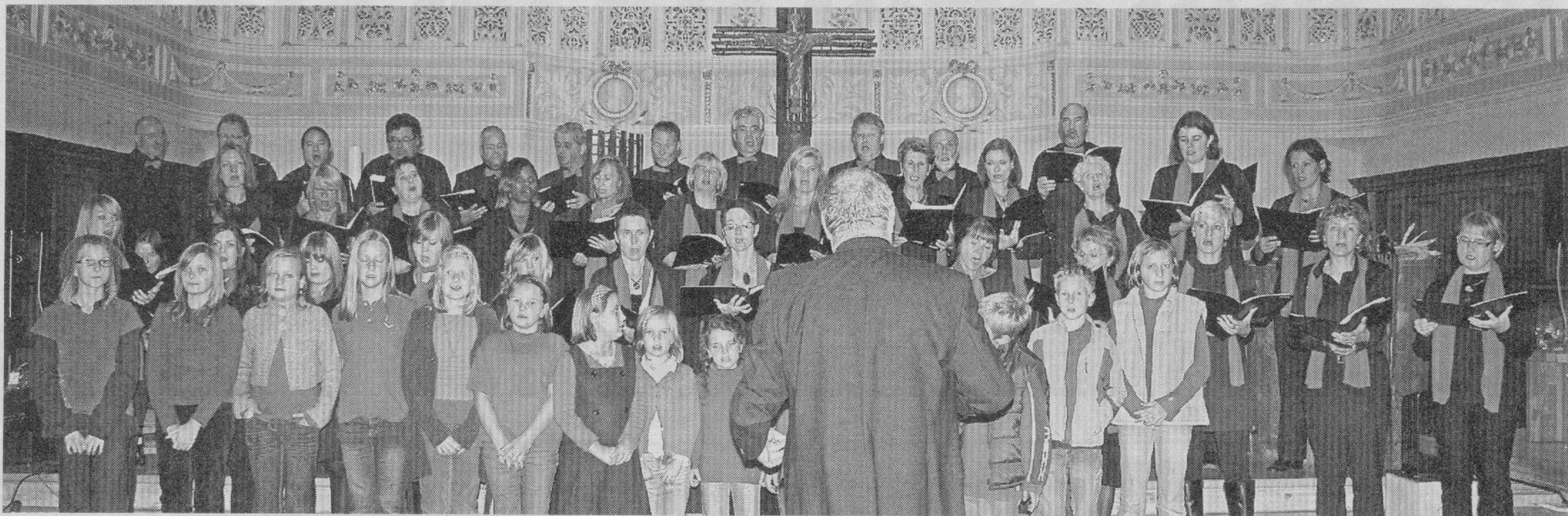
Der Joy&Fun Chorus mit den »Kids« beschenkte die Besucher in der Pfarrkirche mit einem wunderbaren und sehr vielseitigen Konzertabend; hier beim Abschlusslied.